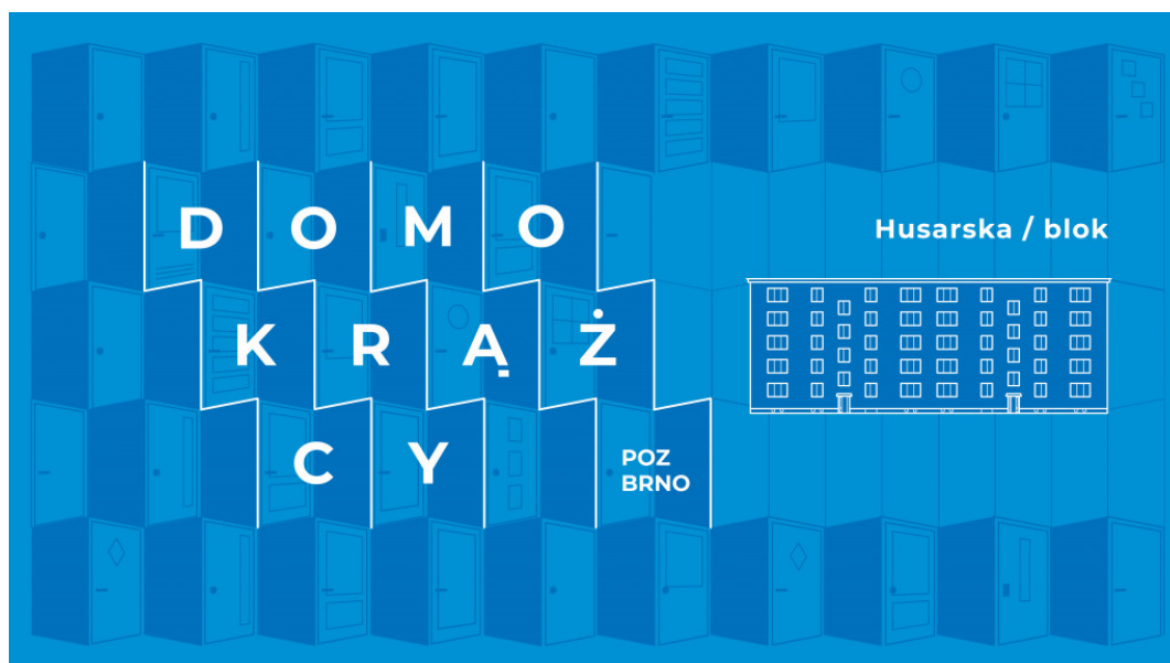
odc. 1 HUSARSKA- mieszkanie

LIPOVA- villa/ BRNO- premiera 26 października