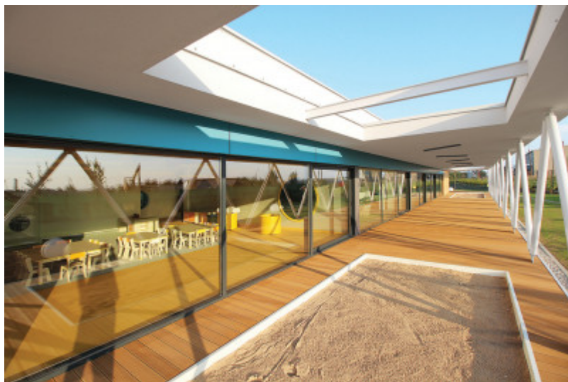
Przedszkole Żółty Słonik w Suwałkach, xystudio