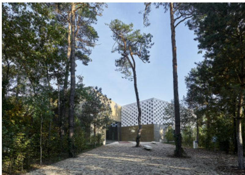
Muzeum Józefa Piłsudskiego w Sulejówku, PIG Architekci