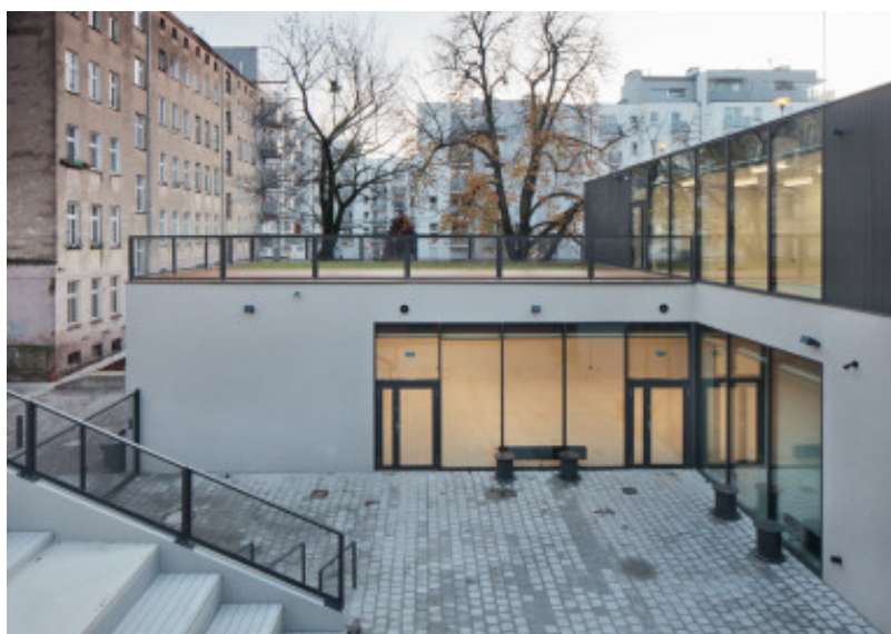
Centrum Aktywności Lokalnej, ch+ architektki