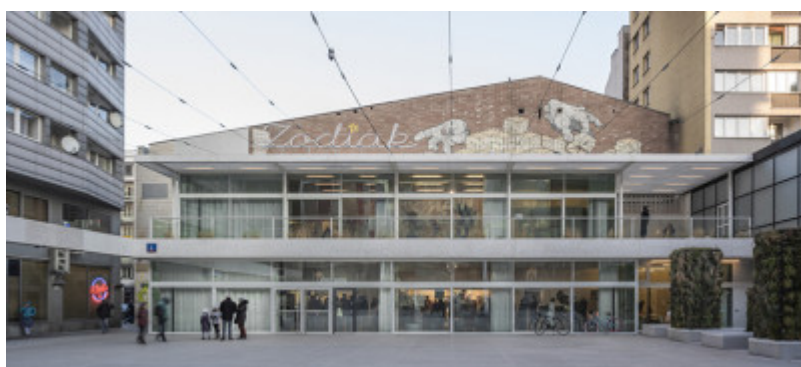
Zodiak Warszawski Pawilon Architektury, Kalata Architekci