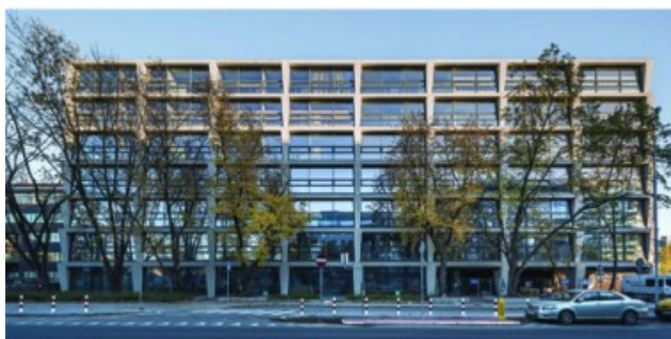
P4 budynek biurowo-usługowo-hotelowy, JEMS Architekci