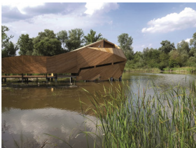
Enklawa przyrodnicza Bobrowisko, 55architekci, fot. W Świątek