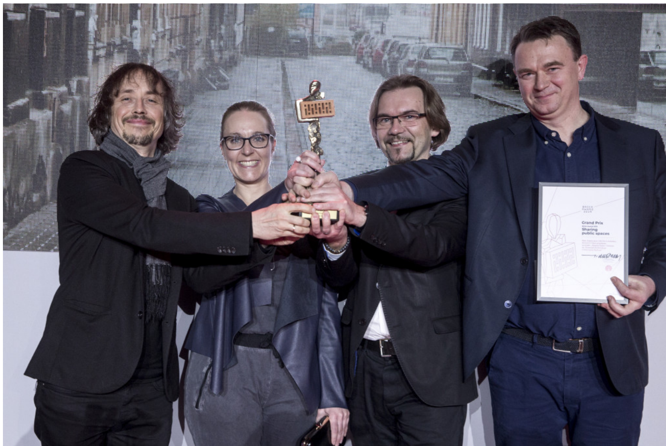
Brick Award 2019 – laureaci Grand Prix