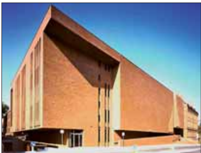
Akademia Muzyczna w Katowicach.