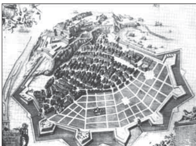
Nicea – ład przestrzenny renesansowego miasta.