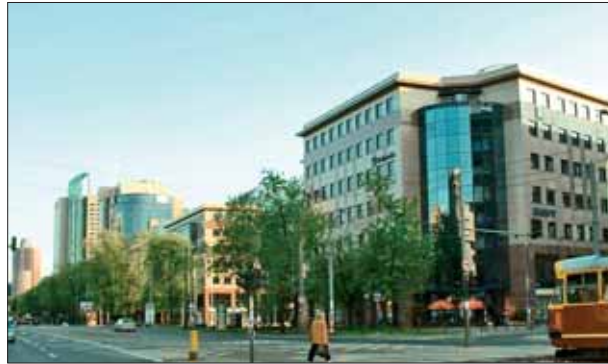
Atrium International Business Center, al. Jana Pawła II w Warszawie.

Diagnoza: Chaos w przestrzeni zurbanizowanej narasta w Polsce z powodu braku kompleksowego podejścia do realizacji urbanistycznych, które mogłyby nadawać charakter i wysoką jakość centrów miejskim oraz przestrzeniom publicznym. W polskich warunkach ekonomicznych wynika to między innymi z nieufności i niechęci do historycznie, ekonomicznie i społecznie uzasadnionej współpracy sektora publicznego z prywatnym przy inwestycjach o znaczącej skali i dużym stopniu złożoności. Wynika także z powszechnego zaniku woli politycznej do ich realizacji. W konsekwencji, mimo wielkich potrzeb, licznych pozytywnych przykładów zagranicznych oraz braku formalnych barier funkcjonowania partnerstwa publiczno-prywatnego (PPP), działań o takim charakterze nie prowadzi się prawie wcale. Przepisy dotyczące partnerstwa publiczno-prywatnego nie są wystarczające dla prowadzenia kompleksowych operacji urbanistycznych, wręcz tworzą dla nich bariery.