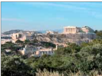
Ateny – tradycja europejskiej kultury – Akropol.