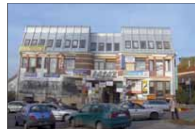
Chaos przestrzeni centrum. Zabudowa spekulacyjna Warszawy. Degradacja krajobrazu Podhala. Zaśmiecona przestrzeń publiczna.