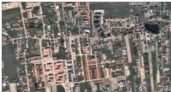
Warszawa Żoliborz – 1 km 2 ładu przestrzennego. Nowa Iwiczna koło Warszawy – 1 km 2 chaotycznej przestrzeni.