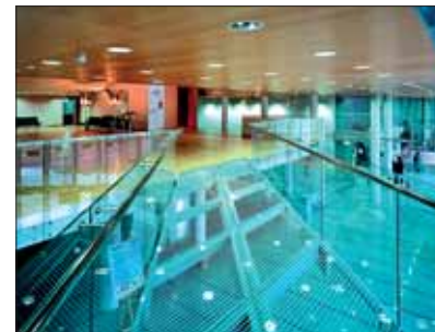
Wnętrze Filharmonii w Łodzi.