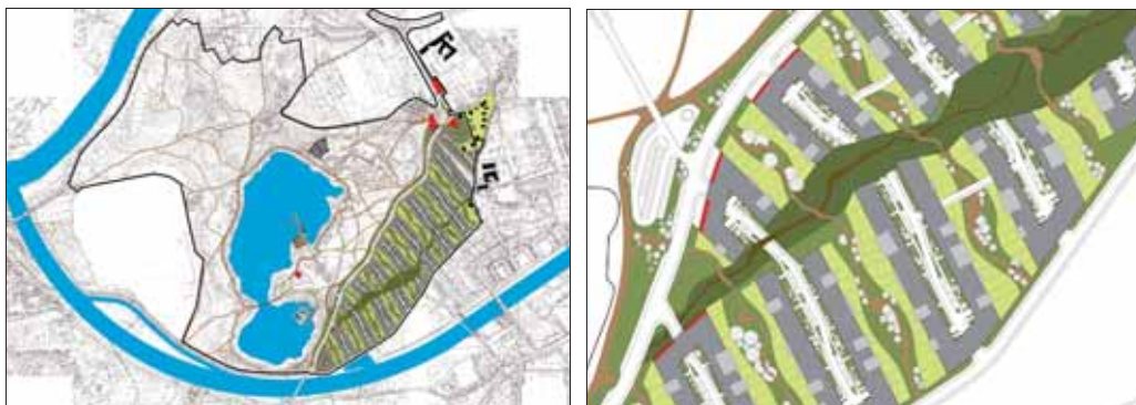
Plan zagospodarowania osiedla Zakrzówek w Krakowie.