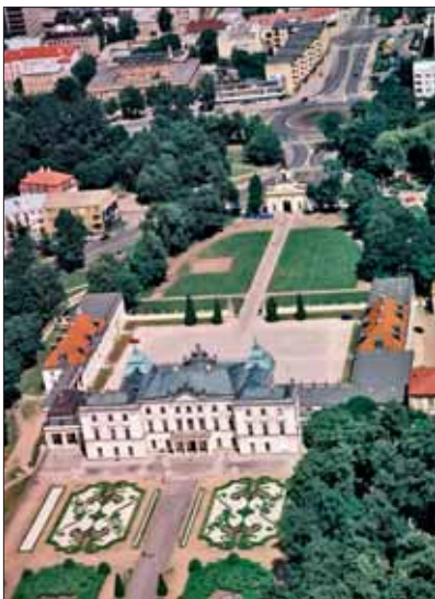
Harmonijne założenie przestrzenne pałacu Branickich, Białystok.

Diagnoza: Zarządzanie przestrzenią, jako dobrem wspólnym, jest często domeną osób niekompetentnych, bez odpowiedniego przygotowania zawodowego, zależnych od koniunkturalnych nacisków politycznych lub działających w sposób doraźny, w czasie wyznaczonym przez okresy między wyborami.