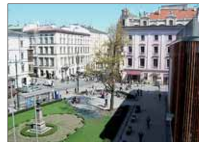
Kraków – plac Wszystkich Świętych.