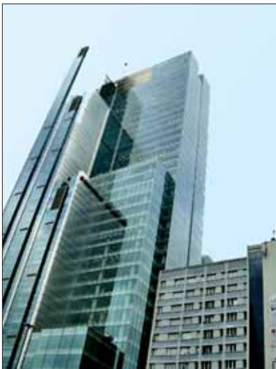
Warszawa – Rondo 1.

jest, że kolejne robocze wersje projektu Polskiej Polityki Architektonicznej były konsekwentnie prezentowane w środowiskowych wydawnictwach oraz na stronach internetowych, tak więc jego opracowaniu towarzyszyła szeroka fachowa dyskusja, dzięki której zespół autorski mógł rozważyć i w dużym stopniu uwzględnić przekazywane mu uwagi.