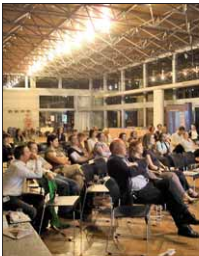
Międzynarodowa konferencja PLAYCE 2006 w siedzibie SARP.

Diagnoza: Rola organizacji profesjonalnych w kształtowaniu ładu przestrzennego, promowaniu dobrej architektury jest słabo dostrzegana wśród społeczeństwa i władz.