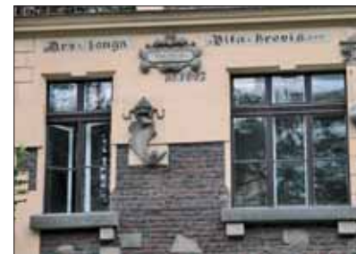
Ars longa vita brevis.