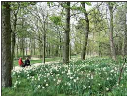
Pieskowa Skala – ogród zamkowy. Park publiczny.