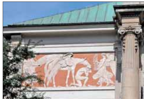
Zakopane – Willa pod Jedłami. Kraków – Pałac Sztuki – fryz dekoracyjny.