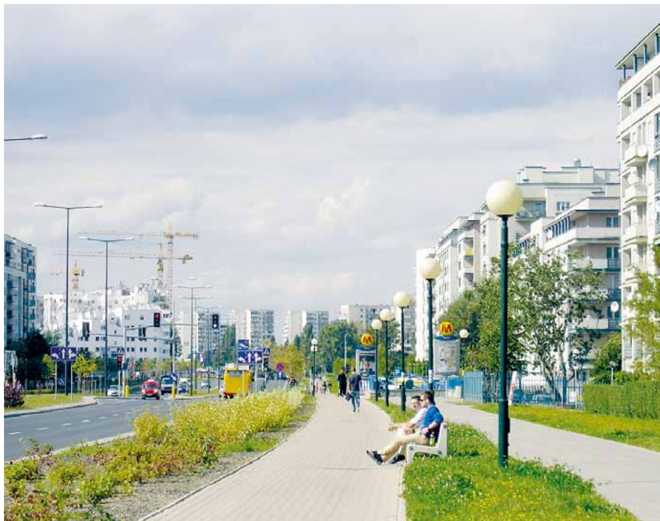
Aleja KEN, Warszawa.