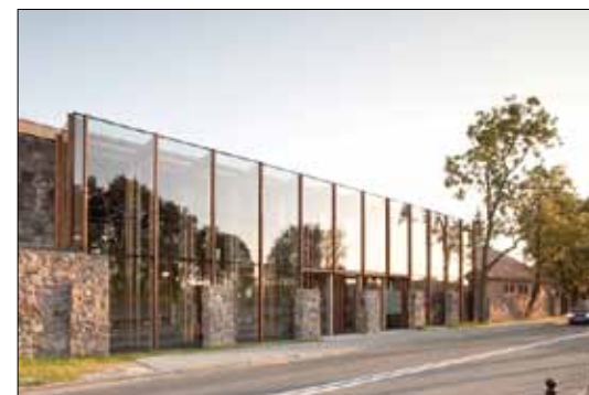
Dom Handlowy Kupiec, Szczecin. Akademia Muzyczna, Katowice. Muzeum Fryderyka Chopina, Żelazowa Wola.