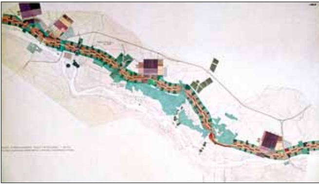
Dolinka Służewiecka, Warszawa Koncepcja miasta pasmowego.