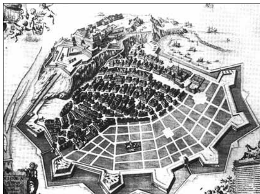
Nicea – ład przestrzenny renesansowego miasta.

Zgodnie z zaleceniami Europejskiego Forum Polityk Architektonicznych kraje członkowskie wdrażają idee ładu przestrzennego poprzez formułowanie „polityki architektonicznej”. Stanowisko Unii Europejskiej w dziedzinie zasad kształtowania środowiska przestrzennego zostało sformułowane w następujących dokumentach: