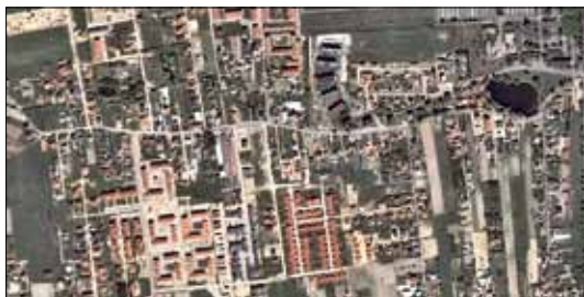
Warszawa Żoliborz – 1 km 2 ładu przestrzennego.