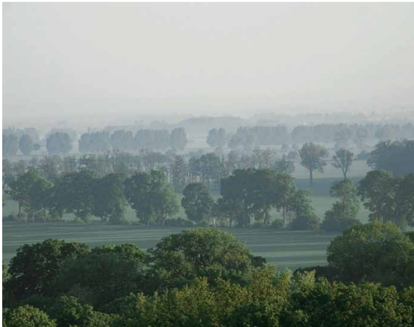
Zadrzewienia śródpolne w Turwi.