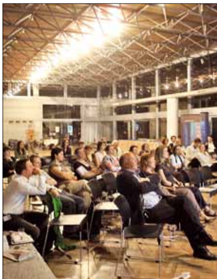
Międzynarodowa konferencja PLAYCE 2006 w siedzibie SARP.

Diagnoza: Rola organizacji profesjonalnych w kształtowaniu ładu przestrzeni, promowaniu dobrej architektury, nie jest dostrzegana przez społeczeństwo i władzę.