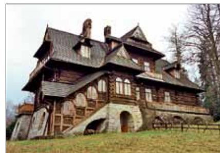
Zagroda gburska w Nadole. Osiedle Nikiszowiec, Katowice. Willa pod Jedłami, Zakopane. Ślady kultury.

Metody remontów rewaloryzacji i termomodernizacji winny sprzyjać zachowaniu oryginalnych wartości architektonicznych i świadomemu dodawaniu wartości przestrzennych.