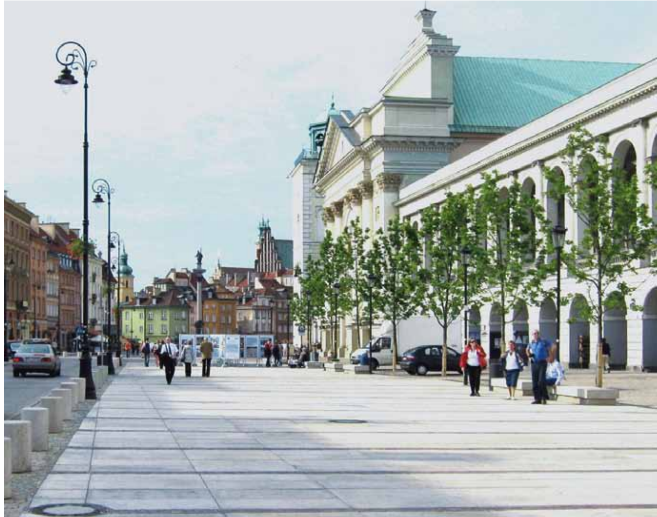
Ul. Krakowskie Przedmieście, Warszawa.