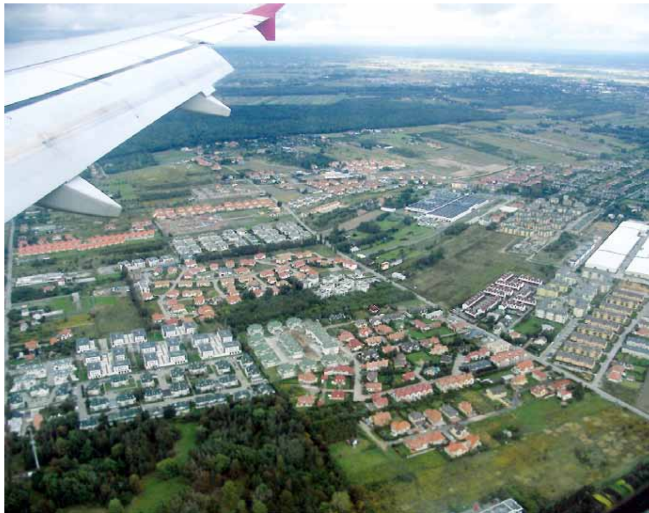
Powrót do Warszawy.