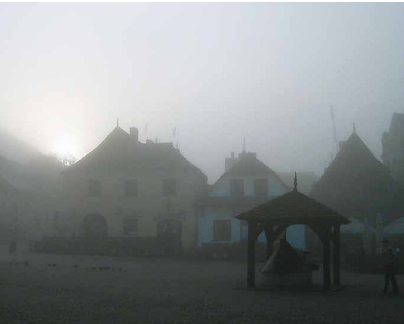
Świt w Kazimierzu Dolnym.