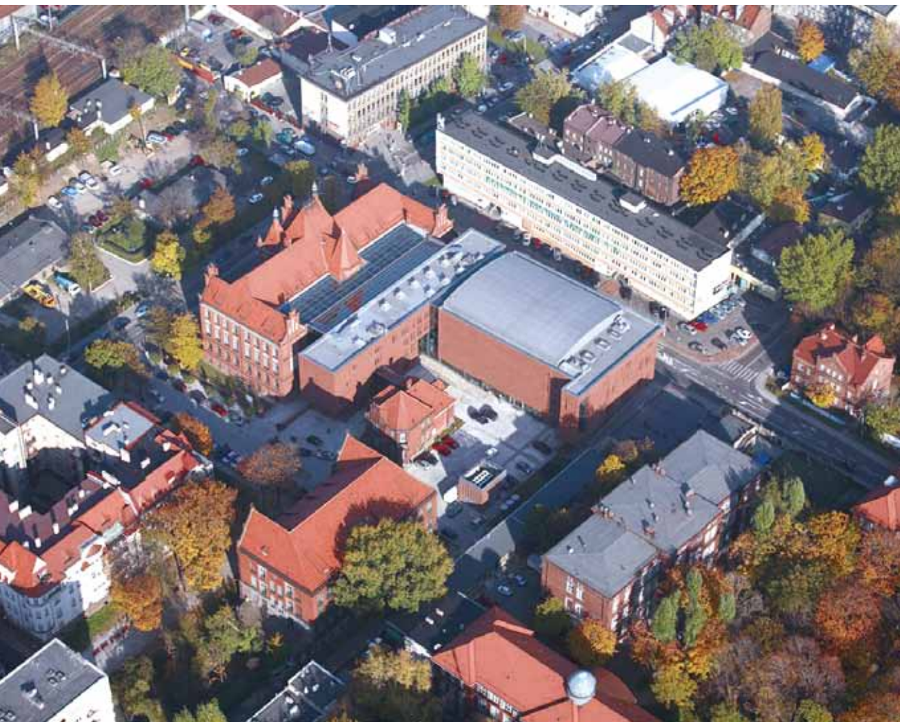
Zespół Akademii Muzycznej, Katowice.