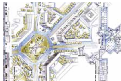
Koncepcja Planu Żoliborza Południowego.