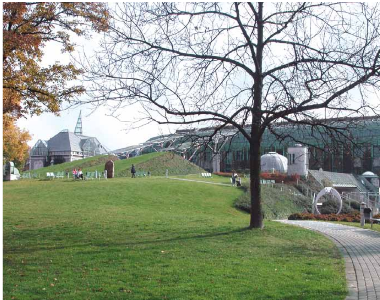
Ogród Biblioteki Uniwersytetu Warszawskiego.