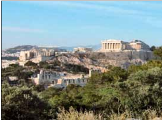
Ateny – tradycja europejskiej kultury – Akropol.