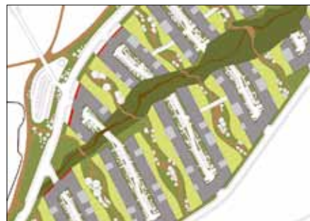
Plan zagospodarowania osiedla Zakrzówek, Kraków.