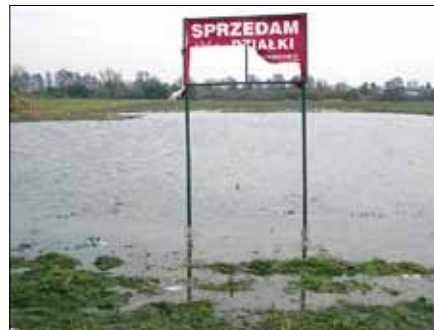
Erozja planu – Nowe Maniowy. „Sąsiedztwo” – Nowa Iwiczna. Wjazd do Warszawy – Raszyn. „Gospodarka przestrzenna”.