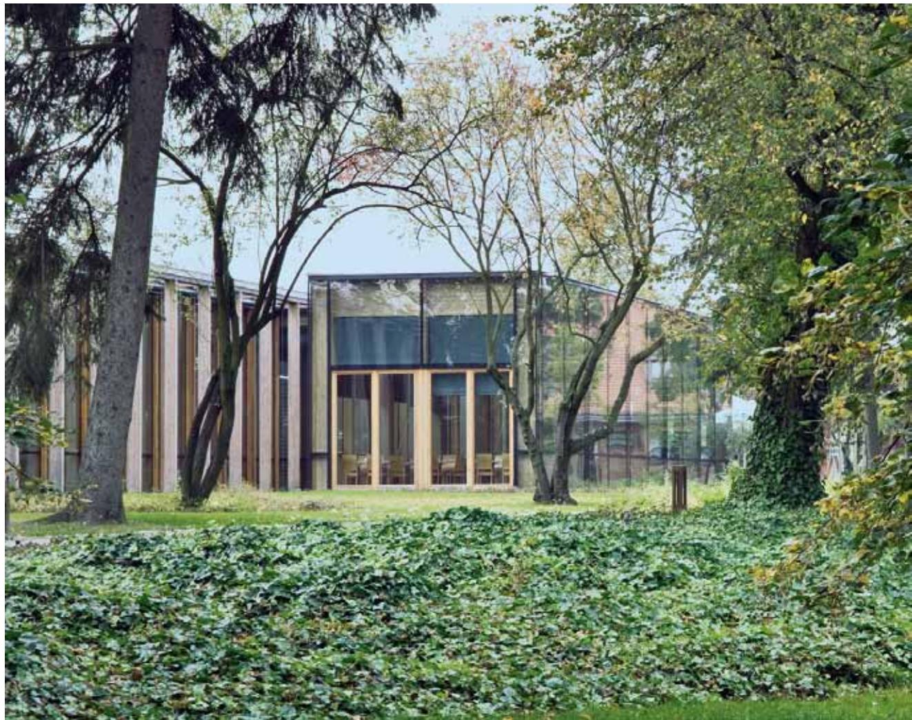
Muzeum Fryderyka Chopina, Żelazowa Wola.