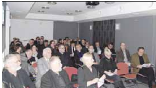
Kongres Architektury Polskiej, Gdańsk 1998. Izba Architektów obraduje.