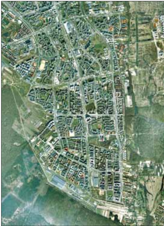
Ostiedle Ursynów – Natolin, Warszawa. Architektura – Przyroda.

Diagnoza: Obecna praktyka zarządzania przestrzenią nie stanowi inspiracji dla innowacyjności w architekturze i urbanistyce. Znaczenie ładu przestrzennego i jakości architektury, jako koniecznych warunków rozwoju zrównoważonego, nie jest powszechnie uświadomione i nie znajduje odbicia w kształtowaniu i użytkowaniu zabudowy.