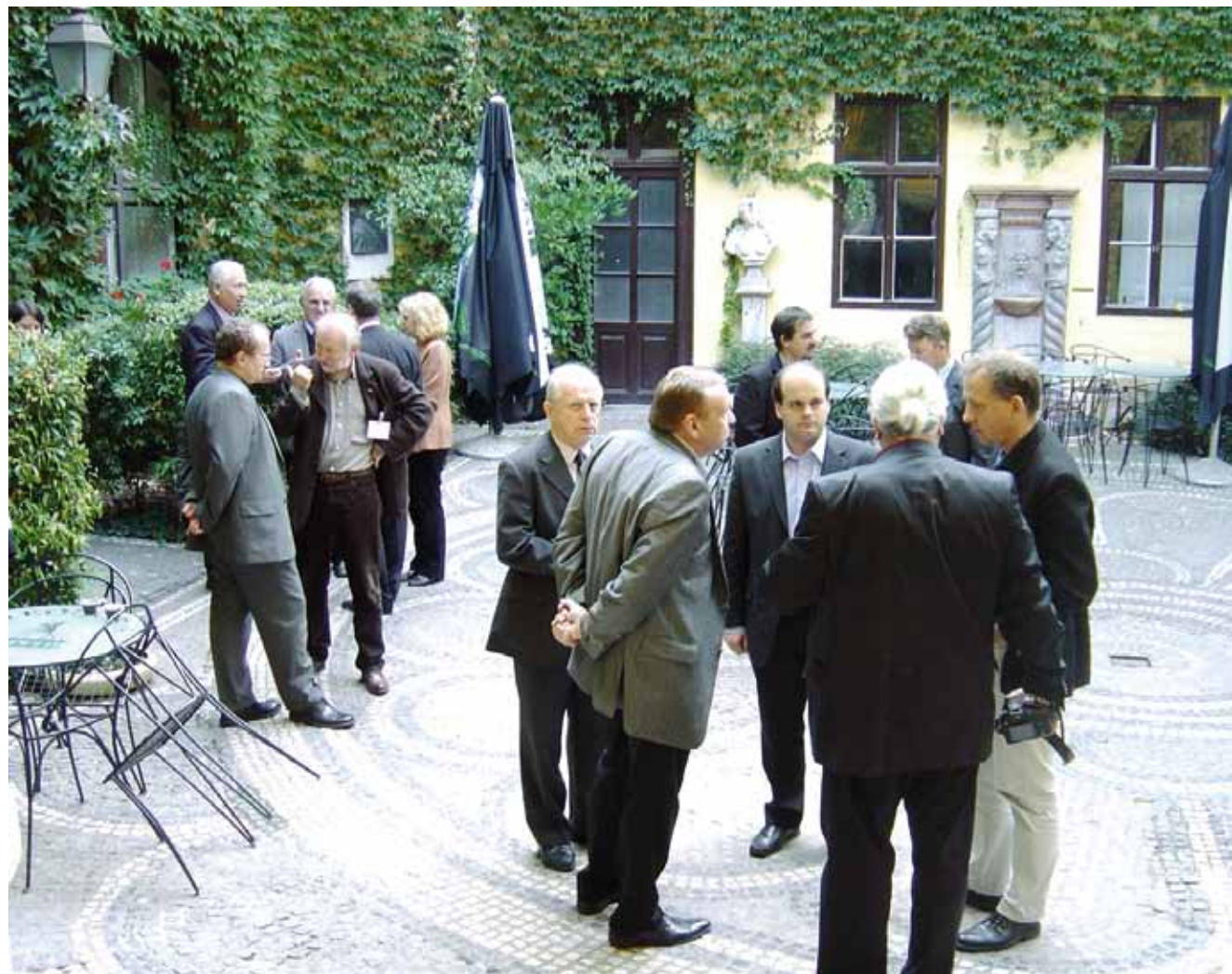
Polityki architektoniczne, debata, Budapeszt, 2008.