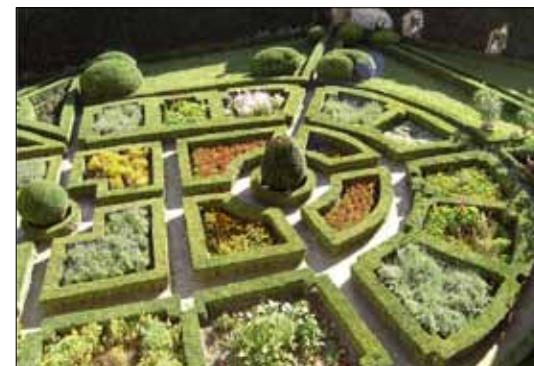
Ogród zamkowy, Pieskowa Skala.

Kształceni na wysokim poziomie architektki krajobrazu powinni uczestniczyć w ochronie i kształtowaniu krajobrazu. Niezbędne jest ustanowienie odpowiednich uprawnień zawodowych dla architektów krajobrazu.