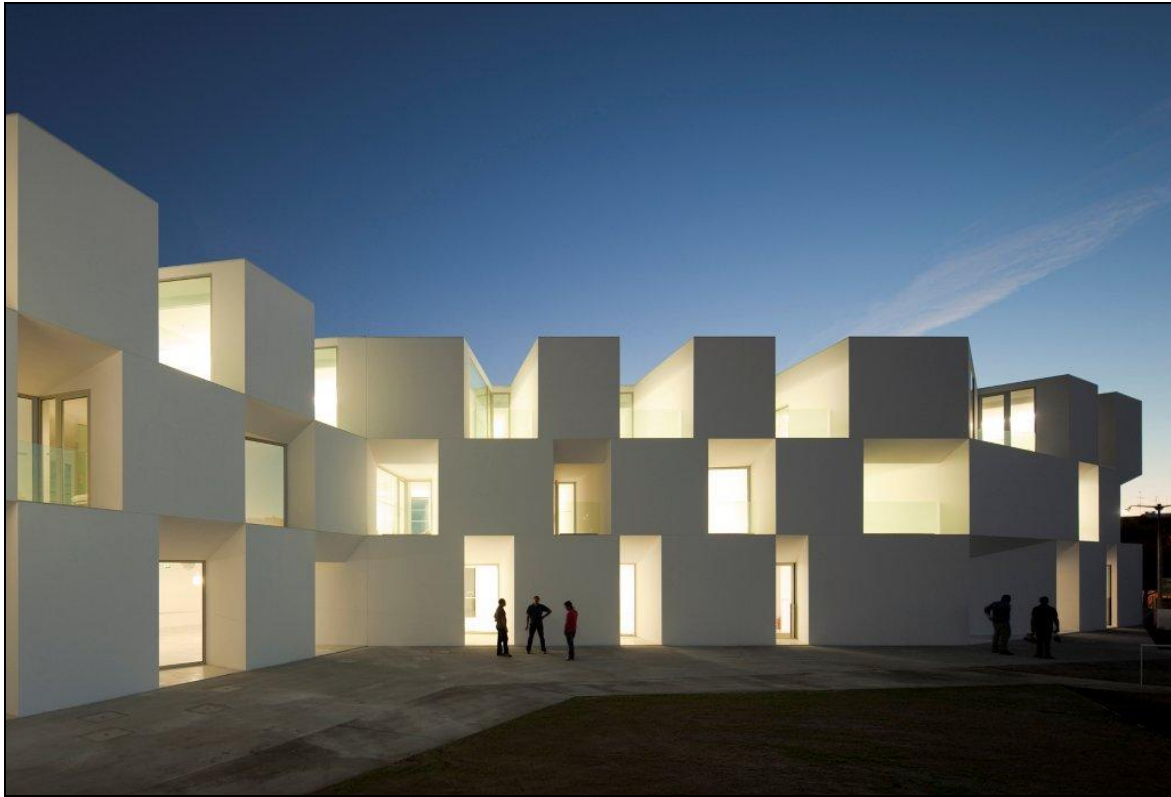
Dom spokojnej starości, Alcácer do Sal