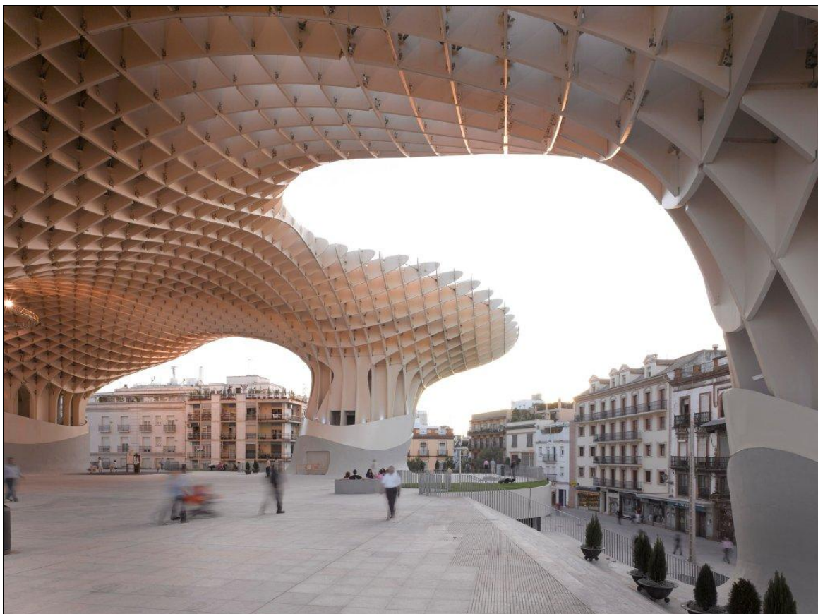
Metropol Parasol, Sewilla