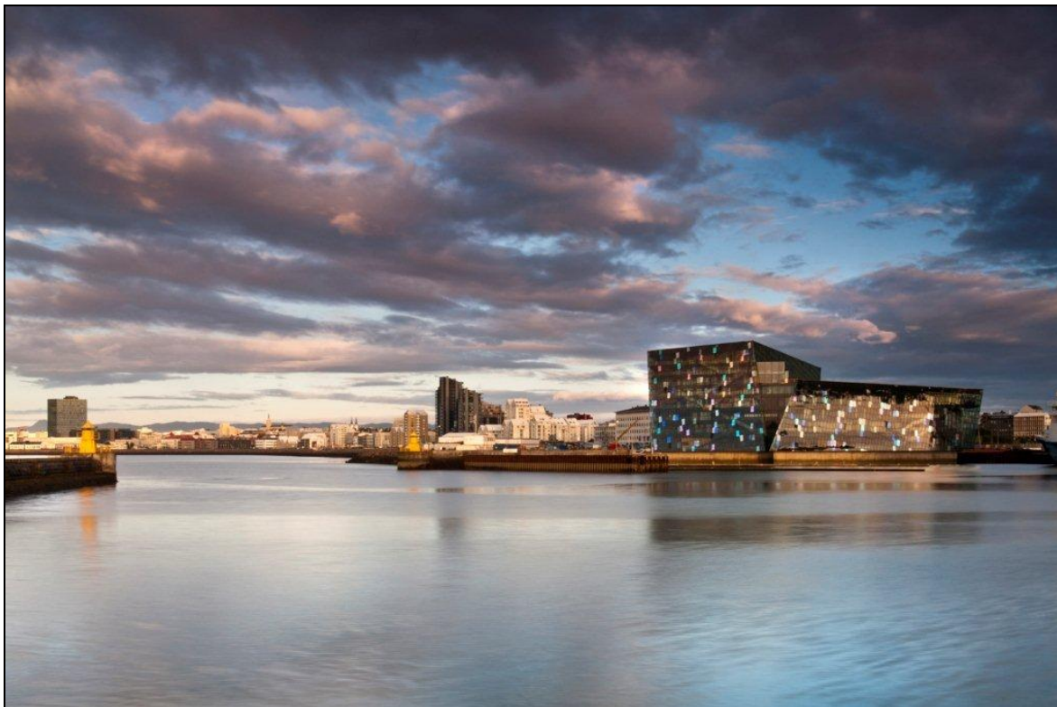
Harpa – sala koncertowa i centrum konferencyjne w Reykjaviku