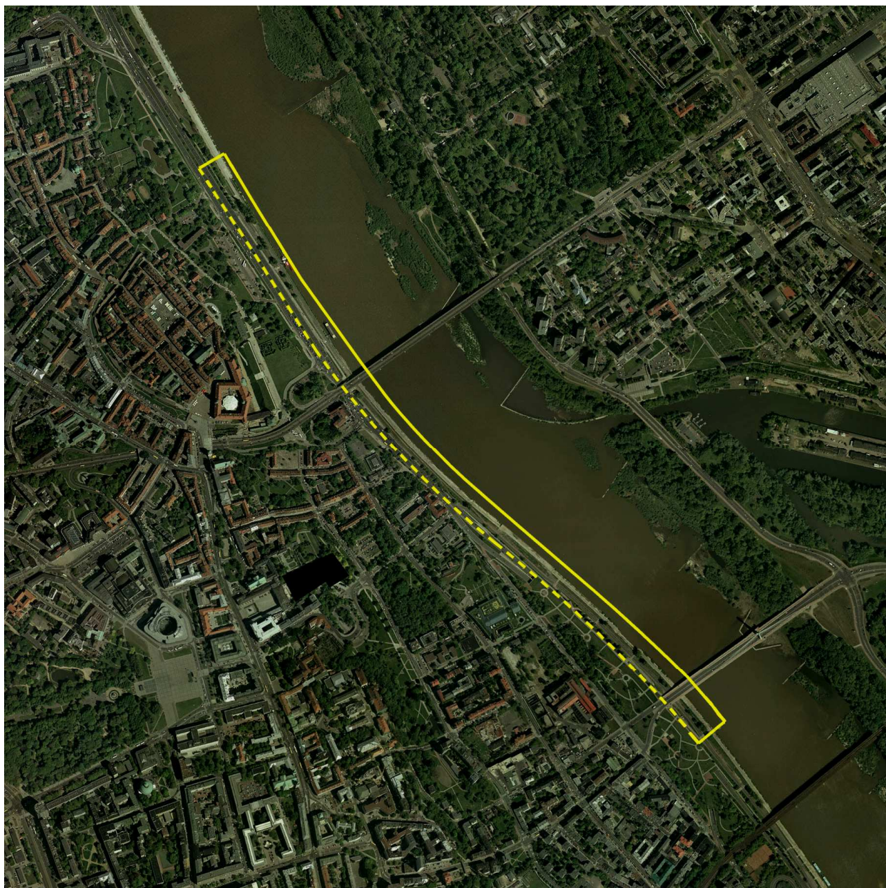
Rys. 1 Granice opracowania (linią przerywaną oznaczono granicę opracowania od strony lądu które ze względu na zadania budowy powiązań bulwaru ze strefą publiczną miasta można przekraczać)