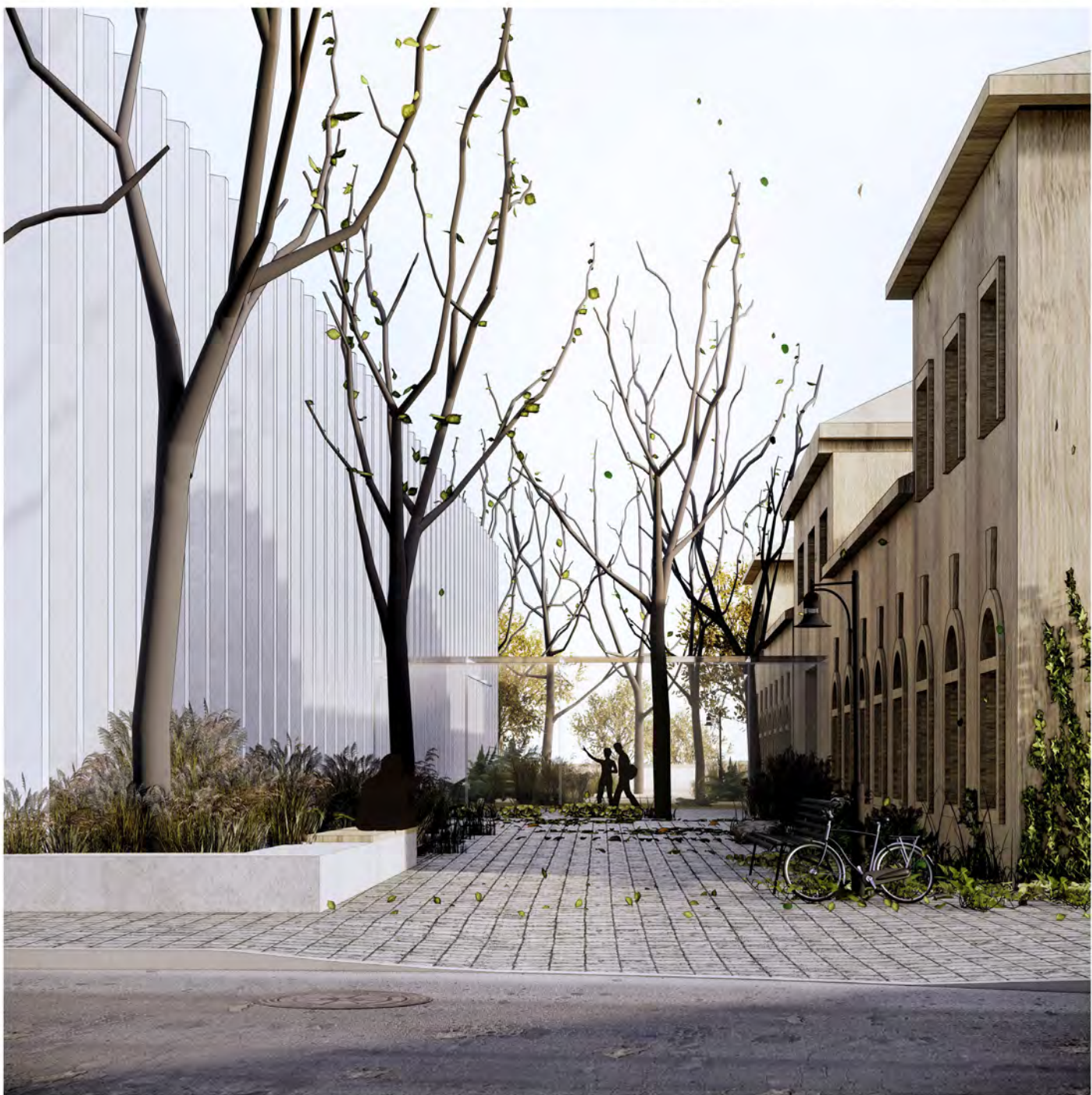
6. WIDOK NA OZIEZDZINIEC OD STRONY ŁAZNI