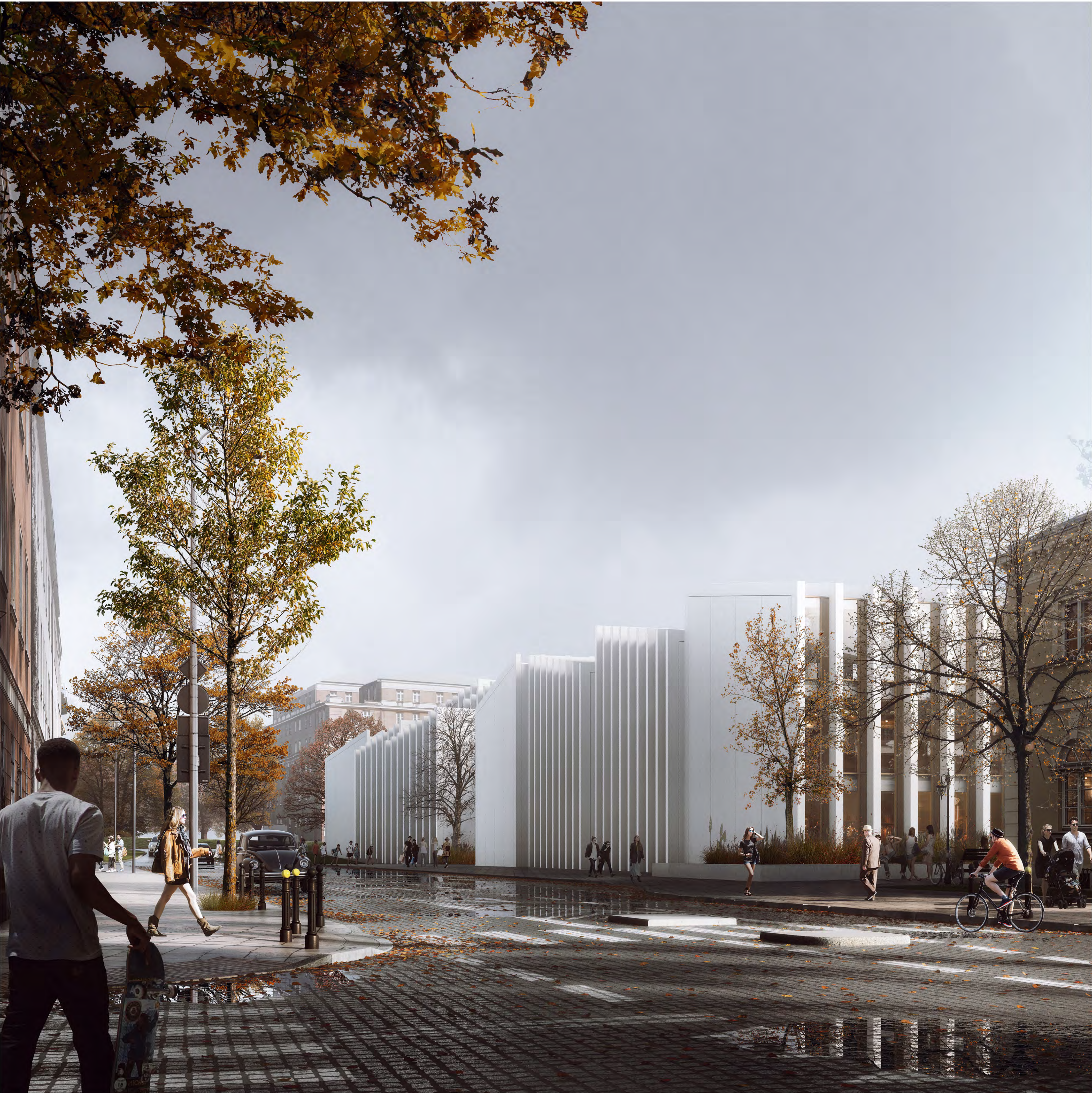
2. WIDOK OD ULICY DOBREJ