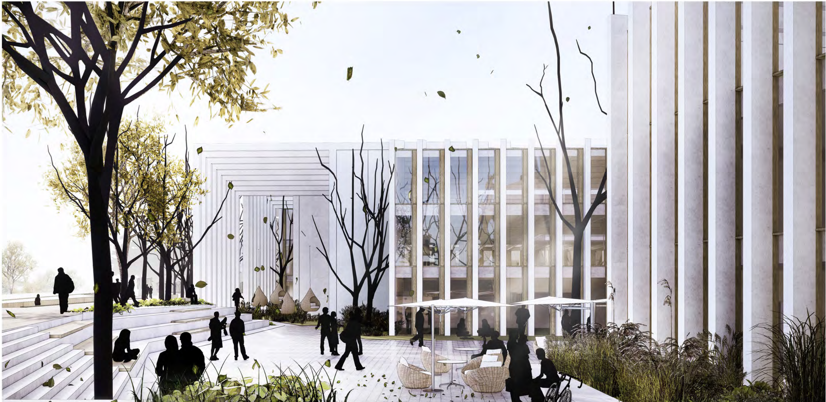
4. WIDOK NA ZAGOSPODAROWANIE TERENU FAZY B