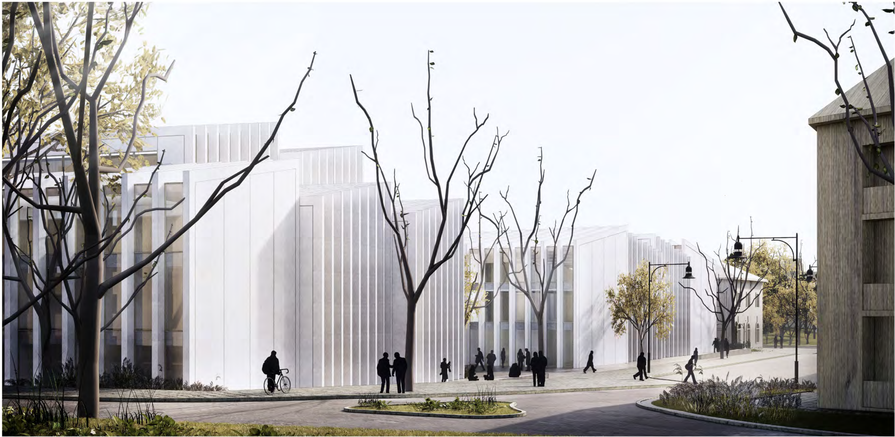
3. WIDOK OD STRONY NOWEGO ZJAZDU