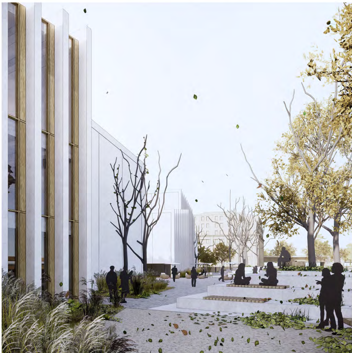
5. WIDOK NA AMFITEATR